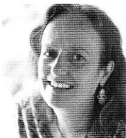
ベニシア・スタンリー・スミス